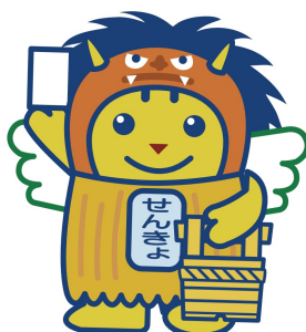
なまはげめいすいくん